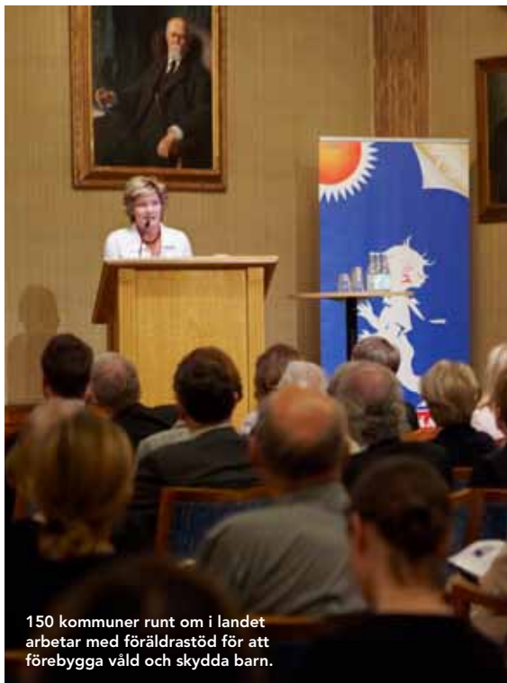
150 kommuner runt om i landet arbetar med föräldrastöd för att förebygga våld och skydda barn.

Enligt Maria Larsson har regering- en en nationell handlingsplan mot