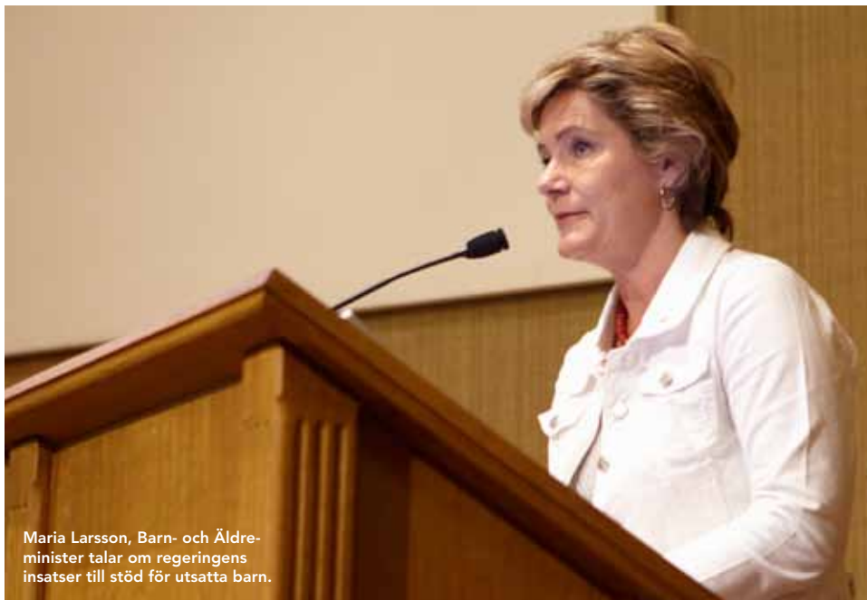
Maria Larsson, Barn- och Äldreminister talar om regeringens insatser till stöd för utsatta barn.

vill. Socialstyrelsens tillsynsenhet bedriver just nu en försöksverksamhet där man har direktkontakt med samhällsvårdade barn. Det finns också ett samarbete med Sveriges Kommuner och Landsting, SKL, om att låta regionala utvecklingsledare arbeta med att utveckla barn- och ungdomsvården.