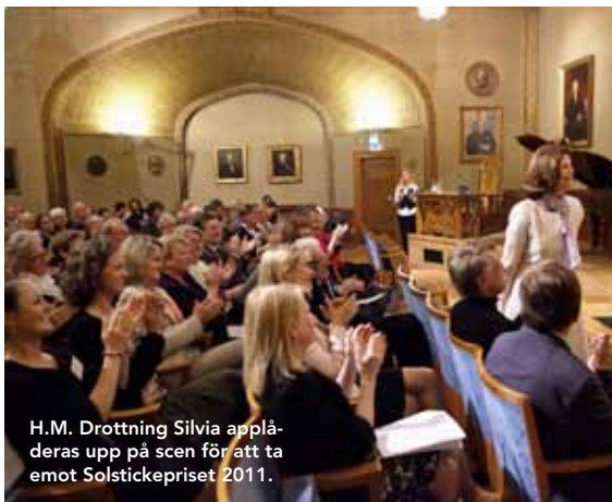
H.M. Drottning Silvia applåderas upp på scen för att ta emot Solstickepriset 2011.

– Jag har hört att av de barn som blivit utsatta för sexuella övergrepp som barn, så utvecklar närmare 85 procent ett missbruk som vuxna. Maria Larsson håller med om att det är nedslående siffror. Det visar hur