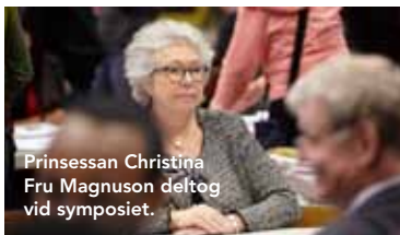
Prinsessan Christina Fru Magnuson deltog vid symposiet.

– Jag lärde känna ungdomarna i Tensta och vann deras förtroende genom att prata när vi spelade bord-